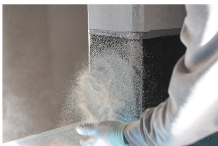
Faza 7: Postupno nanošenje pijeska