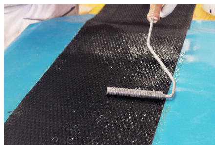
Faza 4: Homogenizacija sredstva za impregnaciju