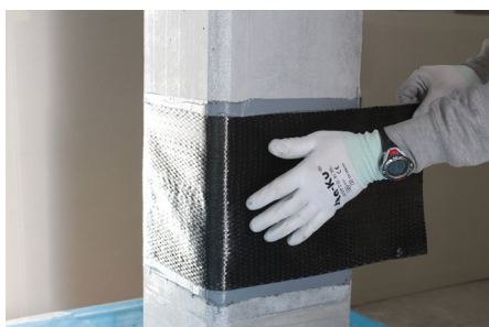
Faza 5: Stavljanje proizvoda FASSATEX CARBON UNI 300 / 600