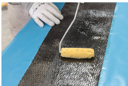
Faza 3: Predimpregnacija proizvodom FASSA EPOXY 200