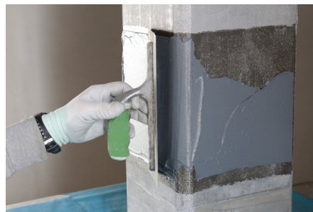
Faza 2: Ujednačavanje proizvodom FASSA EPOXY 400