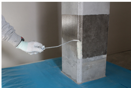
Faza 1: Tretiranje proizvodom FASSA EPOXY 100, gdje je potrebno