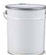
Kante za miješanje